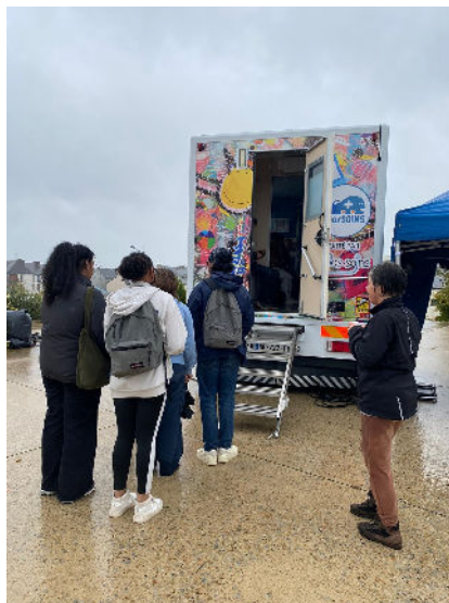
Ces actions ont été portées en partenariat avec l' Assurance Maladie Ile et Vilaine (CPAM) et le bus de prévention Le MarSOINS .